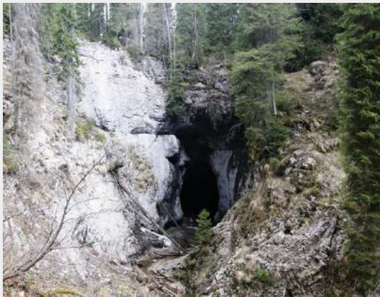
Cetatile Radesei - ulaz