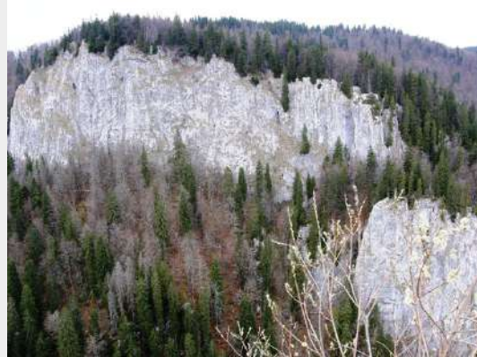
Stene Peretele Cuciulatei