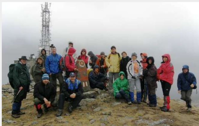
Vrh Cucurbata Mare - 1849m

Povratak u podnožje planine istim putem pa ponovno penjanje iz mesta Nucet na prevoj Vartop gde smo stigli oko 20 časova i smestili se u domu.