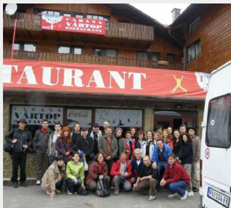
Odlazak iz doma

i dalje čekali poboljšanje vremena. Negde pre 12 sati vreme se stabilizovalo pa smo krenuli na jednu kraću turu po okolini Vrtopa, odnosno do lokaliteta, ogromnog odrona - urvine Groapa Ruginoasa. Kada smo stigli do ivice odrona još je bila magla pa nismo mogli ništa videti, možda samo pedesetak metara. Nastavili smo dalje stazom kroz šumu preko jednog brda/1426m/, zatim sišli na prevoj, pa preko vrha Vartop otišli još malo napred, zatim sišli u dolinu reke Ariešul i uz dolinu putem se vratili na Vartop. Dužina ture je bila oko 10km. Deo grupe je ponovo otišao do Groapa Ruginoase jer se vreme bilo poboljšalo. Imali su sreće da vide ogromnu, strumu, crveno-žutu izbrazdanu urvinu u pravoj veličini.