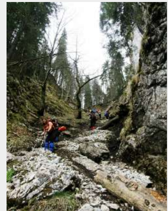
Silazak niz kuloar

Uspion do pećine Honu, pa blaža staza ispod vertikalnog stenovitog zida Peretele Cuciulatei. Vodopad Moloh nismo videli, jer je ponovo trebalo silaziti strmom stazom do doline, već smo nastavili dalje, prešli ponovo reku i došli na ono mesto gde iz pećine, ili podzemnog tunela ističe voda. Sada je deo grupe, ko je hteo i imao baterijske lampe, ušao u pećinu uz pomoć lanaca, prošli kroz nju i izašli na drugu stranu. U pećini se nalaze velike ledenice u obliku stalaktita koje se tope i otpadaju. Istom stazom kao u dolasku vratili smo se do mini-buseva.