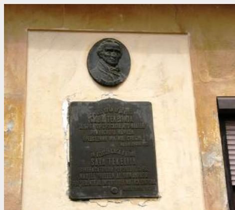
Kuća Save Tekelije

Sa zbornog mesta krenuli smo pre 15 časova i preko Temišvara stigli rano na granicu. Nismo se dugo zadržali i Beograd stigli oko 19.30, tako da su i somborci mogli natenane da jezde u ravnu Bačku.