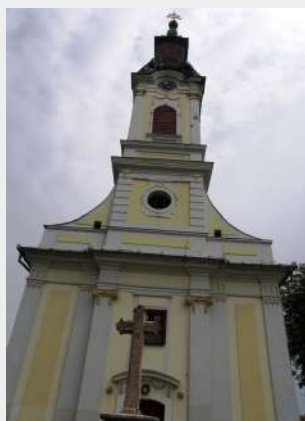
Srpska crkva u Aradu

Tu smo se zadržali malo više od tri sata. Osim glavnog centralnog dela otišli smo do srpske crkve posvećene Sv.Petru i Pavlu, ali nismo nikoga našli tamo, crkva je bila zatvorena. Nalazi se u jednom prilično zapuštenom delu grada. U blizini crkve se nalazi ulica Save Tekelije u kojoj je kuća gde je on nekada živeo.