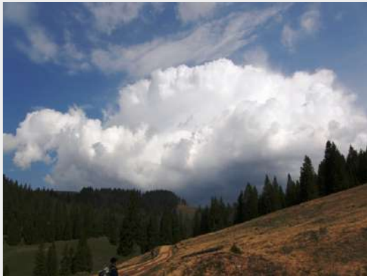
Vladeasa, tipičan predeo

Iz Skerlićeve smo krenuli sa dva mini-busa u 20 časova. U grupi je bilo tridesetdva planinara. Preko Vršca i Temišvara stigli smo do Arada a onda prema Salonti smo sporo napredovali jer se put proširuje pa smo na mnogobrojnim semaforima izgubili mnogo vremena. Još gore stanje je bilo na putu u podnožju planine. Gore uz planinu na putu sa serpentinama takođe se izvode radovi ali nije bilo većih zadržavanja osim što su busevi zbog velikog nagiba brektali i jedva uspeali da se dokopaju ravnijeg puta, i nekako stignu do Cabane Varasoia.